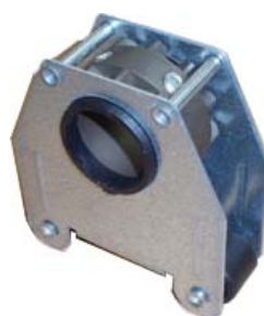
Caja de piñón TU5/30 4R